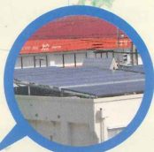
琉球ていーだ発電所